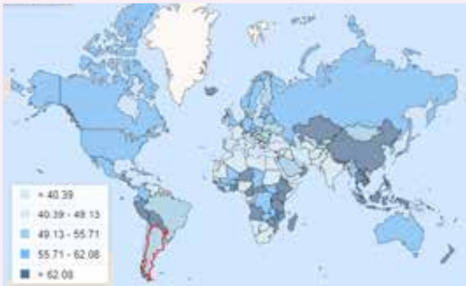
Imagen N° 1. Tasa de empleo (en % sobre población de 15 años y más), 2019