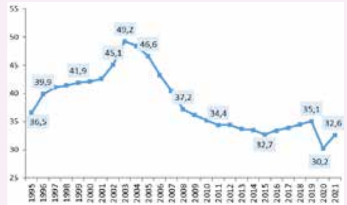
Gráfico N° 2. Peso de los asalariados no registrados sobre el total de asalariados, 1995-2021 (en porcentajes)

Nota: la serie previa a 2003 surge del empalme con las estadísticas de ese año, dado el cambio metodológico que tuvo la EPH.